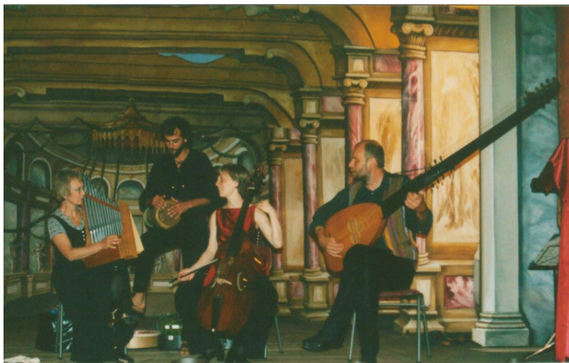
PASSO E MEZZO im Ekhof-Theater Gotha (Juli 2002)

2 bis 5 professionelle Musiker/Darsteller